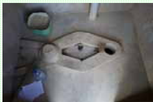
Intérieur de la latrine