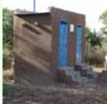
Bloc de 2 latrines