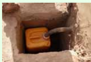
Bidon de récupération des urines