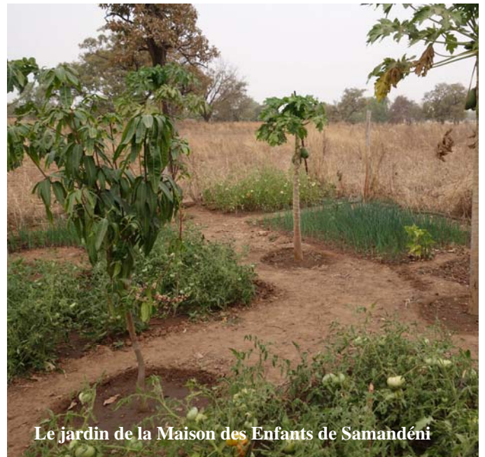
Le jardin de la Maison des Enfants de Samandéni

Ainsi votre parrainage mensuel vous revient à 8.50 €