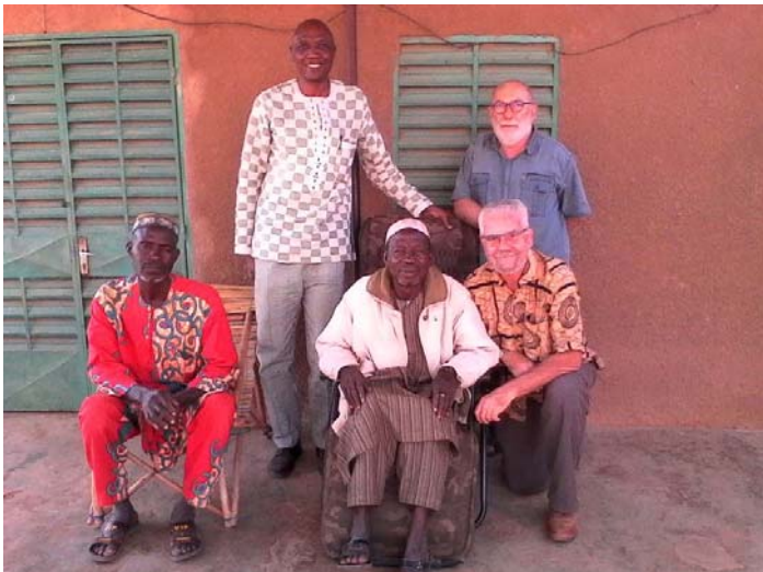
Salutations traditionnelles au chef du village