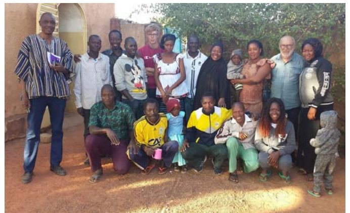
Un grand merci à toute l'équipe de Samandéni de la Maison des Enfants et du Campement pour l'accueil et la gentillesse à notre égard.