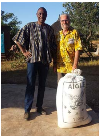
Achat par Le Neemier d'un sac de 100 Kg de petit mil qui permettra de préparer la bouillie du matin pour les enfants pendant 6 mois.