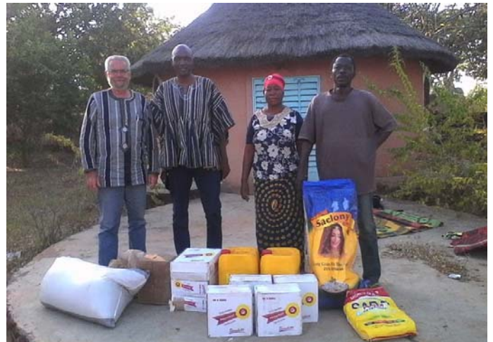
Les orphelins de la maison des Enfants de Samandéni profitent des bénéfices du concert de clôture du festival Bassitara-Neemier. Nous avons pu faire une première série d'achat alimentaire