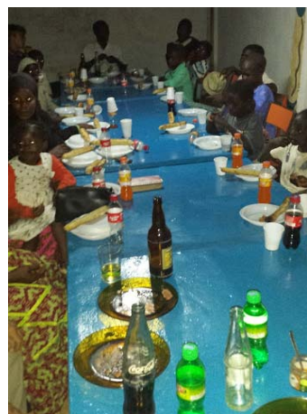
Repas amical avec l'ensemble des Enfants du personnel avant notre retour en France. Un moment toujours chargé en émotion.